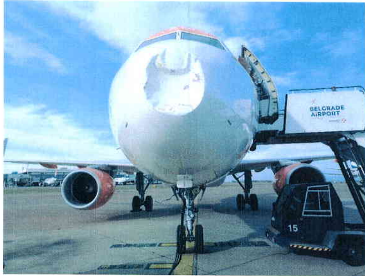
Слика оштећења на авиону

Током увиђаја од стране истражитеља Центра и детаљног визуелног прегледа авиона, установљено је веће кружно структурално оштећење радарске куполе у зони врха и благо лево од врха у правцу кретања авиона, са увлачењем структуре радарске куполе, а без трагова који би указали на контакт са птицама, метеоролошким балоном и другим физичким узрочницима оштећења који би могли да дејствују на структуру радарске куполе. У овој незгоди није било повређених лица.